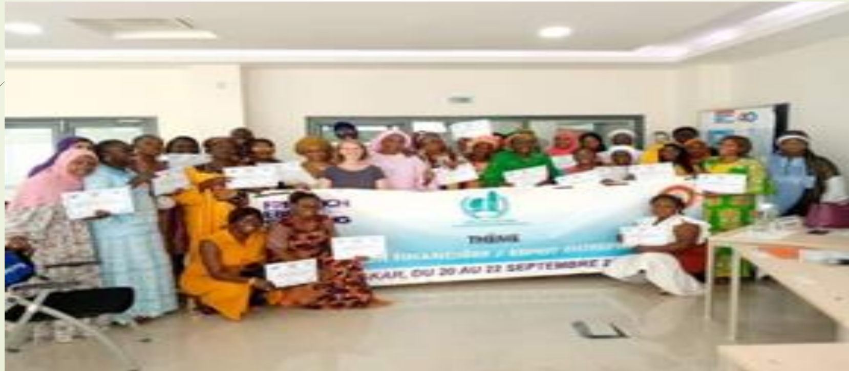
AG RSMMS 2023/ LAMERZIA